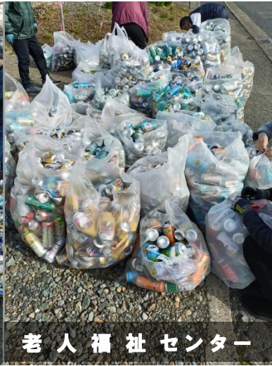
老人福祉センター